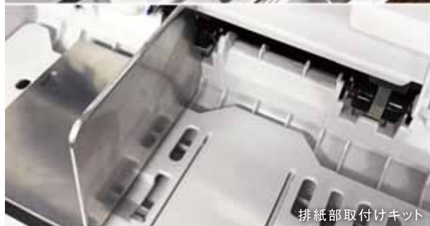
排紙部取付けキット